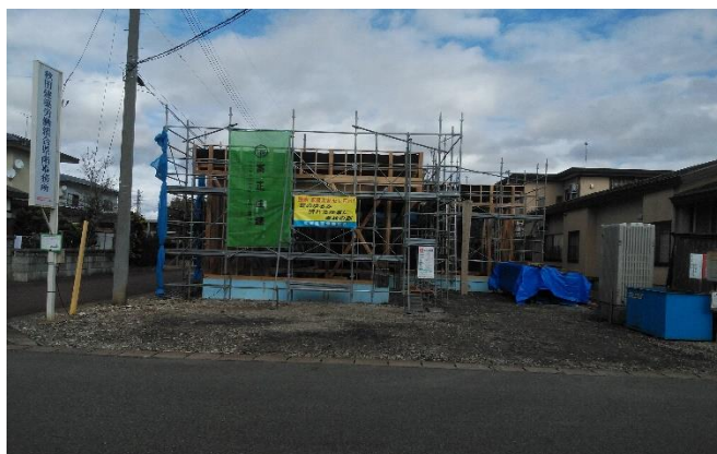
棟上げ あんぜん標語もバッチリ