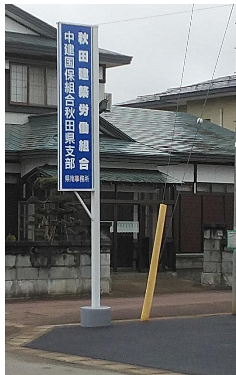
看板も新しくなりました