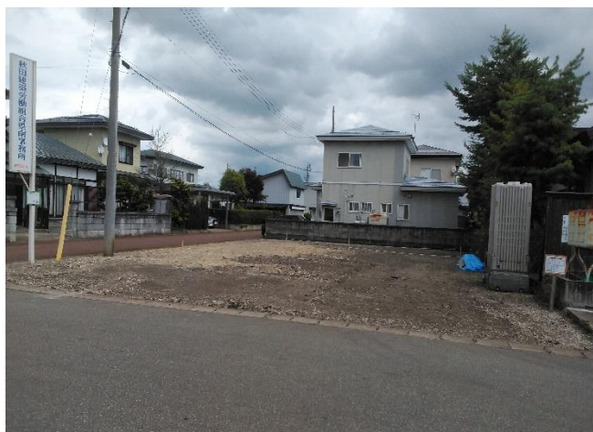
更地になりました