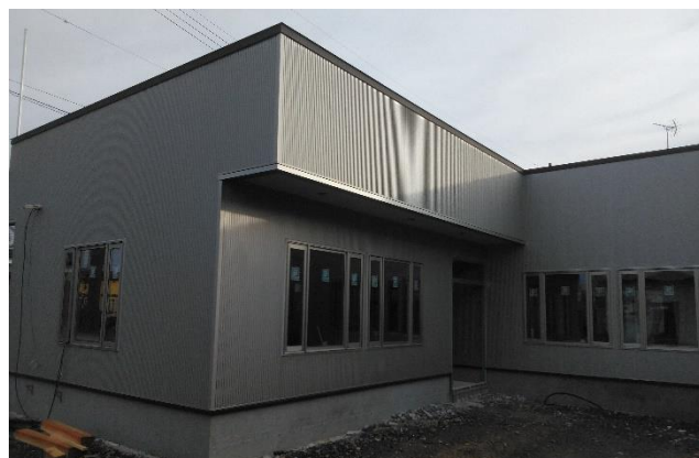
外壁はガルバリウム鋼板