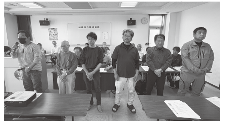
新執行委員の皆さん

いただき、全国32支部 の中でも、指折りの実 績を残していたいただき皆 さんのご奮闘に感謝申 上げたい。 令和8年度は、医療 分と介護分の保険料は 据え置きましたが、子 ども子育て支援金制度 の創設により、国に納 付することになる支援 金分の保険料について は組合員と家族の皆さ んに1人月額平均で4 00円程度の負担をお す。