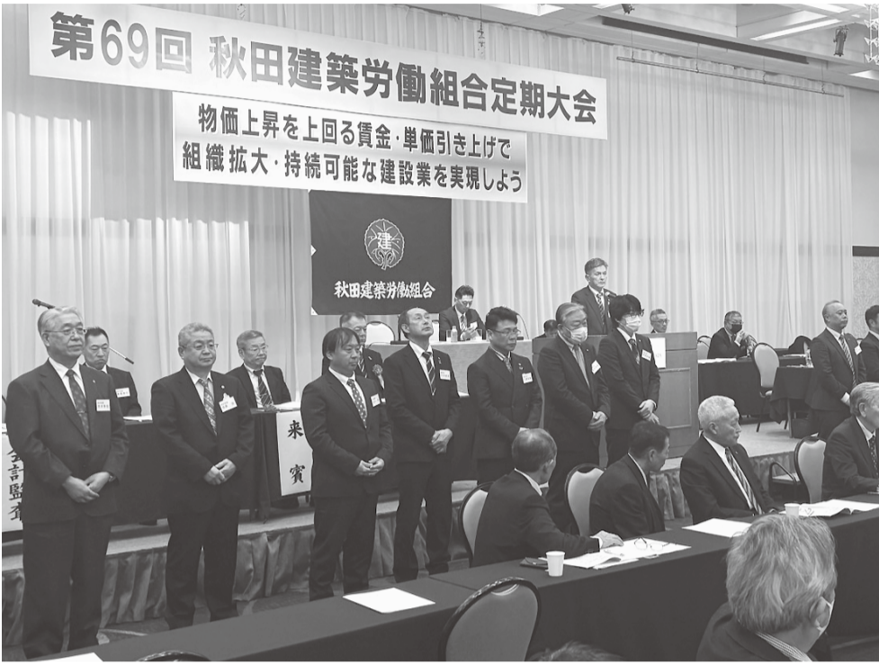
第69回 秋田建築労働組合定期大会 物価上昇を上回る賃金・単価引き上げで 組織拡大・持続可能な建設業を実現しよう

発行所 秋田建築労働組合 〒010-0061 秋田市御町三丁目4-5 TEL (018) 865-2291 (代表) URL http://www.akita-kenro.com メールアドレス akita@akita-kenro.com 発行責任者 千葉直樹 編集者 猪田博