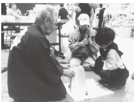
大きな金づちでトント

支部役員の皆さん、これからも地域に根ざしたアイデア・活動よろしく願います。ごみ袋ありがとうございます。(シャイな金物工)