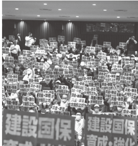
プラカードを掲げる参加者

全体集会を終えて地元国会議員要請を行い、千葉組合長は「建設国保は仲間と家族に最適な医療保険が提供できるように、医療費の適正化や保健事業の推進に日々努めている。今後も建設国保が安定運営できるように、現行補助水準を確保してほしい」「インボイス制度は改善の見えない経済状況を踏まえ負担軽減措置の延長が不可欠」と訴え、国会議員秘書に要請書を手渡しました。秘書は「みなさんにとって大事な建設国保の予算確保に向け全力で取り組むことやインボイス制度に関する要望もしっかりと伝える」と協力を約束しました。