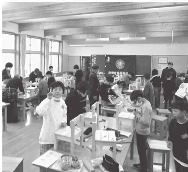
オリジナルの椅子に夢中

そこからもう一仕事!出来上がった椅子にオリジナルの絵を描いていきます。カラーマジックを使いアニメのキャラクターや普段頑張っているスポーツの絵などをそれぞれ個性が光ります。楽しいです。