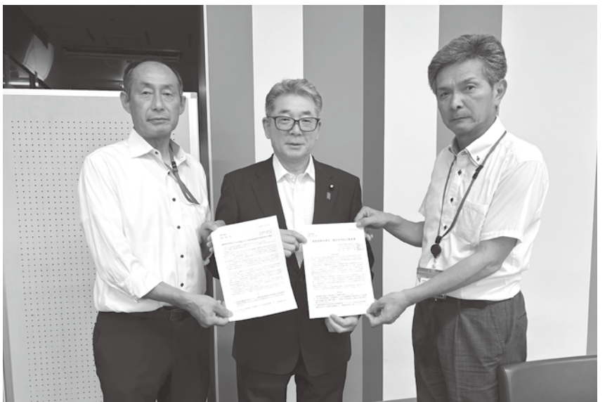
久米書記長、富樫衆議院議員、千葉組合長