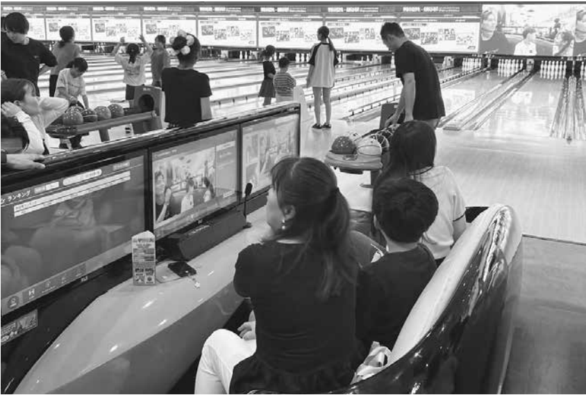
ボウリングを楽しむ様子

8月3日、ラウンドワン秋田店にて青年部レクリエーションを開催しました。青年部員10名・家族27名・事務局1名の合計38名が参加しました。去年の参加人数は28名だったので、今回はそれを上回る参加者が集まりました。