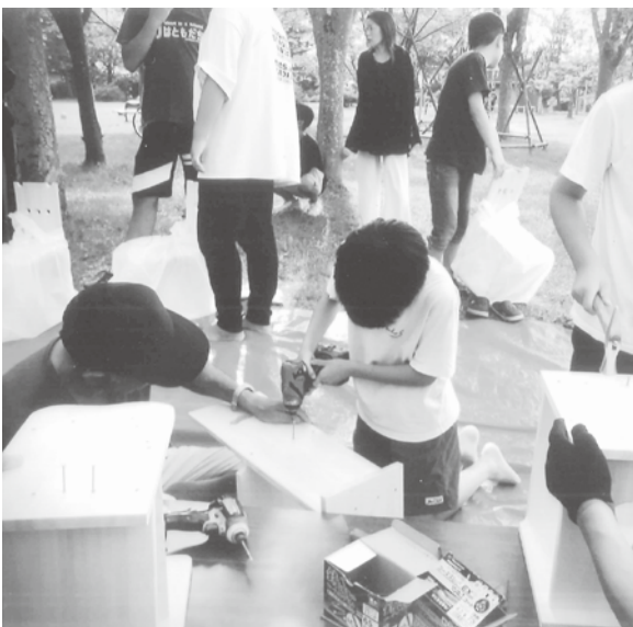
慣れない手付きで椅子作り

多く聞いています。8月23日、秋田南支部では御野場南部街区公園にて、夏祭りに協賛し住宅デーの木工教室を行いました。地域の皆さんにも恒例行事として認識されており、この日を楽しみにしているとの声を聞き、この日を楽しみにしています。朝6時30分から5人で TENT を張り、机、椅子を並べ設営をしました。また町内会では組合のアピールとして準備したPRチラシを配布し、木工教室の宣伝をしてくれました。開始時間になると、参加者は初めての経験に興奮と緊張しながらも楽しんでいました。今回も参加してくれた組合員の協力と指導のおかげで、25セットが1時間15分で完売に達しました。また、受付で住宅相談のアンケートを行なったところ、住宅のコーキングの相談があり、支部員で対応にあたりました。