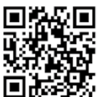
【熱中症ガイドメイン】