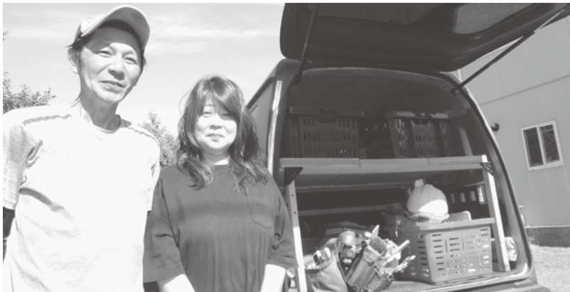
愛車の中は作業道具がビッシリ