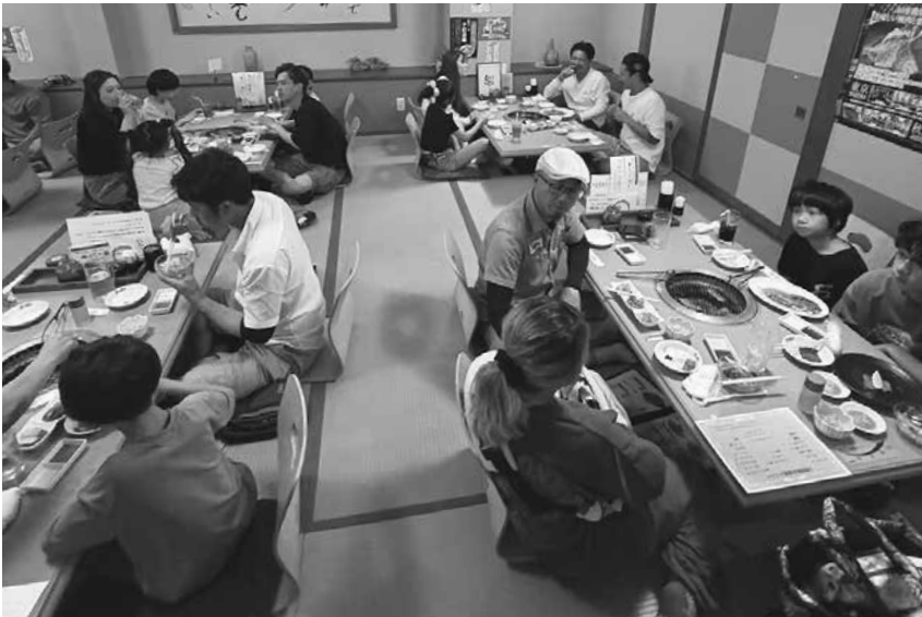
大盛り上りの懇親会