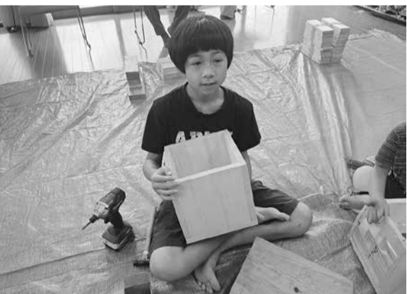
上手にできました