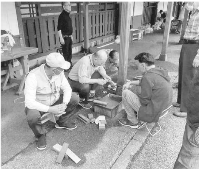
腕の見せどころ、包丁研ぎはバッチリです