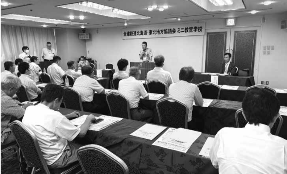
真剣に講演を聞く参加者

「建設国保の育成強化、物価上昇を上回る賃金・単価引き上げ、予算要求中央総決起大会」が開催されました。新築・リフォームへの助成拡充、自然災害から地域を守る、建設技能者の確保・育成、建設キャリアアップシステムの登録・普及促進、対、インボイス制度の見直し・緩和措置の延長を