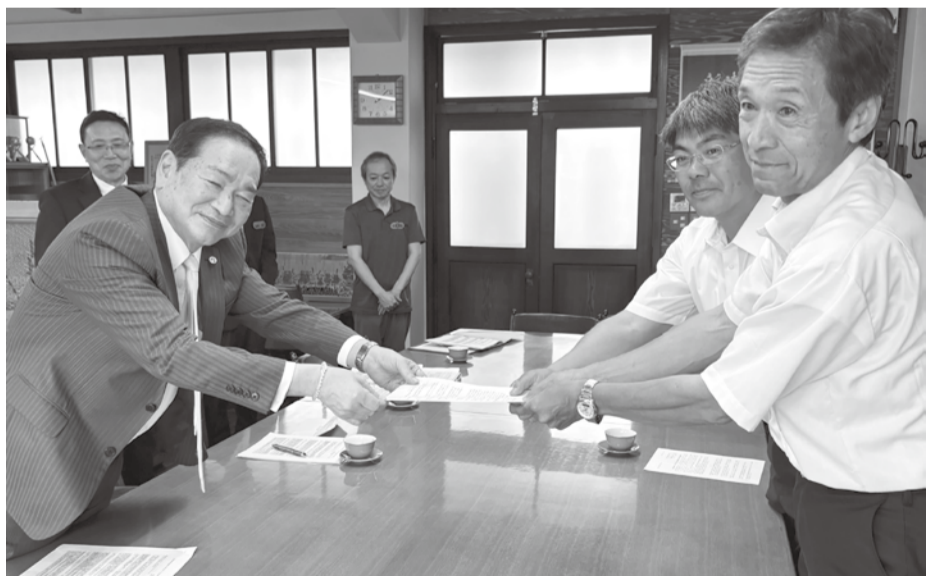
齊藤市長(左)に要請書を手渡す