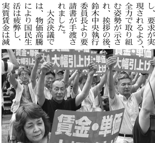
プラカードを掲げ一致団結

「賃上げチャレンジミッション」を掲げ、労働者、一人親方、事業主がそれぞれの立場から一体的な運動を展開する方針である。また、「働き方改革」の周知、CCUSの登録促進と課題の解決。建設国保は働く者の「命の綱」であり現行水準確保のため、はがき要請行動に旺盛に取り組もう。インボイス制度の見直し緩和措置の強く求めらる60万人要請署名を進