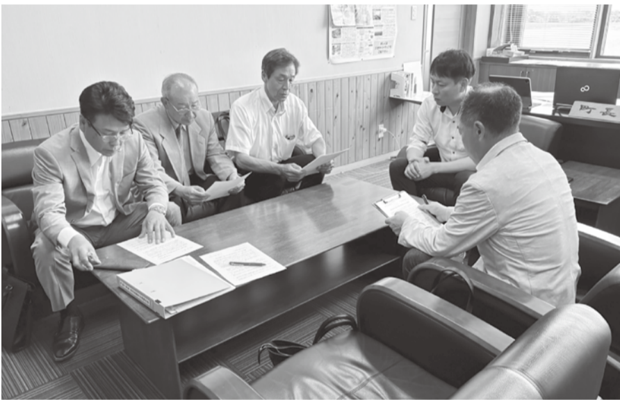
話合いの様子(八峰町)

要請項目①適正な賃金の支払いと法定福利費の確保②賃金・単価の引き上げ処遇改善③建設キャリアアップの対応と普及④公契約条例の早期制定⑤リフォーム助成事業の実施