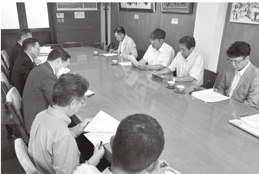
話合いの様子(能代市)

要請項目①適正な賃金の支払いと法定福利費の確保②賃金・単価の引き上げ処遇改善③建設キャリアアップの対応と普及④公契約条例の早期制定⑤リフォーム助成事業の実施