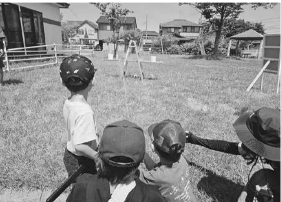
水消火器を使って消火訓練