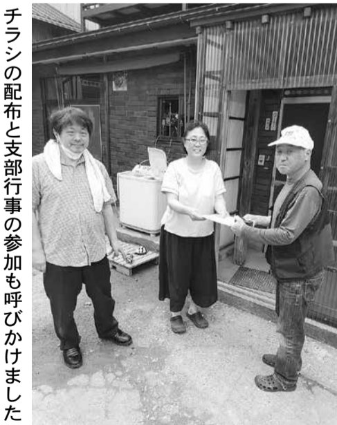
チラシの配布と支部行事の参加も呼びかけました

雄和地域の班長宅7件を訪問し、日頃の労いや活動に関しての感謝を伝えると共に、未加入者紹介チラシを配布しながら、組合や総合共済の説明をし、今後の支部活動への参加や協力と組織拡大推進についてお願いをしました。