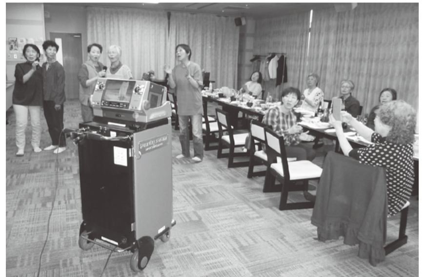
カラオケで大合唱

5月17日、15名の参加でポルター湯の湯でグラントゴルフを兼ねてのレクリエーションの予定でしたが、あいにくの雨で中止となり、ゆっくりとした一日を過ごすことになりました。 早々に「道の駅おおがた」に寄り新鮮な野菜がた〜に寄り新鮮な野菜がた〜に寄り新鮮な野菜がた〜 お楽しみ会の宴会が始まるカラオケで大盛り上がり、昭和の歌で皆若返りました。外は雨模様でしたが室内は熱気にあふれていました。最後は日本三大県民歌と称されている秋田県民歌を合唱してお開きにしました。 余裕のあった一日だったので皆さんと親睦を深めることが出来ました、楽しかったです。