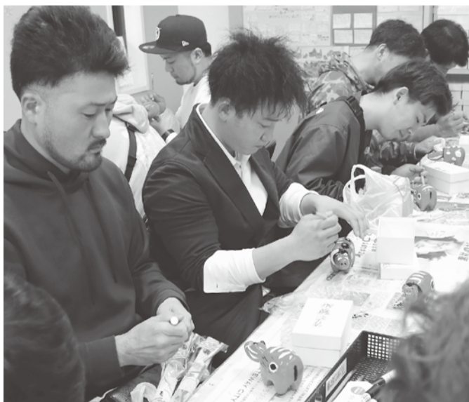
秋田建労の参加者

訪れました。飯盛山からは会津の城下町が一望でき、そこではさざえ堂と白虎隊記念館を見学しました。 さざえ堂は、「円通三匠堂（えんつうさんそうどう）」というお堂で、内部には二重らせん構造の通路があり、通路が二重になっているためお堂を上ると下る人が同じ通路ですれ違うことが無いように作られています。 白虎隊記念館では、白虎隊をはじめとする戊辰戦争に関連する様々な資料を見学しました。夜には懇親会が開かれ、北東の仲間たちと親睦を深めることができました。 2日目は、会津地方に伝わるあかべこの絵付け体験と鶴ヶ城の見学が行われました。絵付け体験では参加者それぞれ個性が光るユニークな作品が完成し