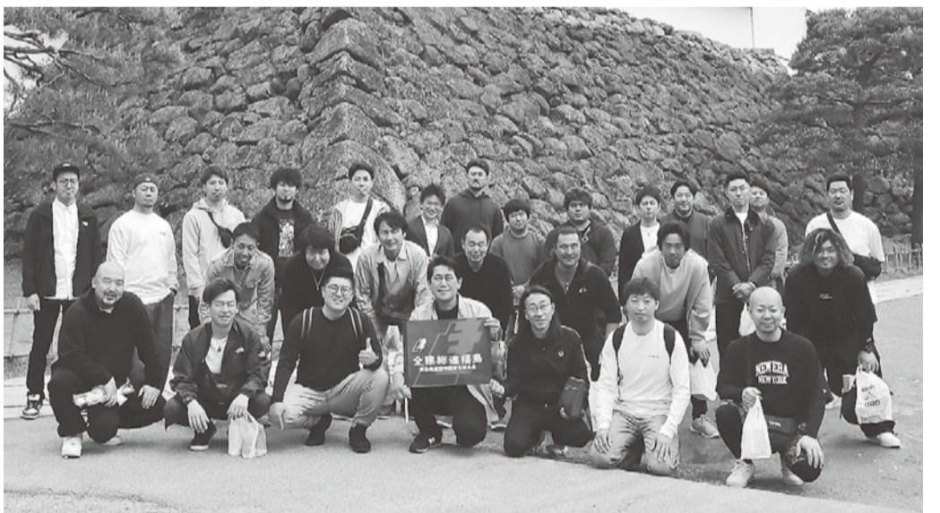
鶴ヶ城前で記念撮影

ました。鶴ヶ城には国内唯一の赤瓦をあしらった天守があり、ここでもたくさんさんの歴史に触れ、解散となりました。 秋田からは初めて交流集会に参加したメンバーもあり、「北東の仲間との交流を通して地元組合でも積極的に活動していきたい」と今後の活動に向けた意欲を語ってくれました。