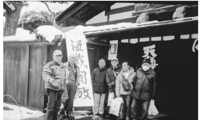
造り酒屋の前で一枚

当日は矢鳥の造り酒屋で蔵開きがあり、到着早々に新酒の啣酒を堪能し、気に入った新酒を買い求めたり屋台を眺めたりしながら楽しみました。帰りも由利高原鉄道に揺られ本