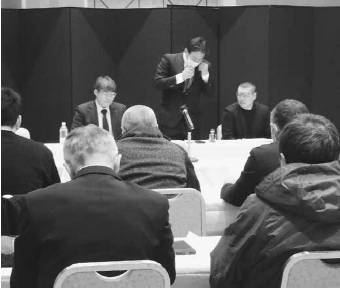
各報告を開く支部員