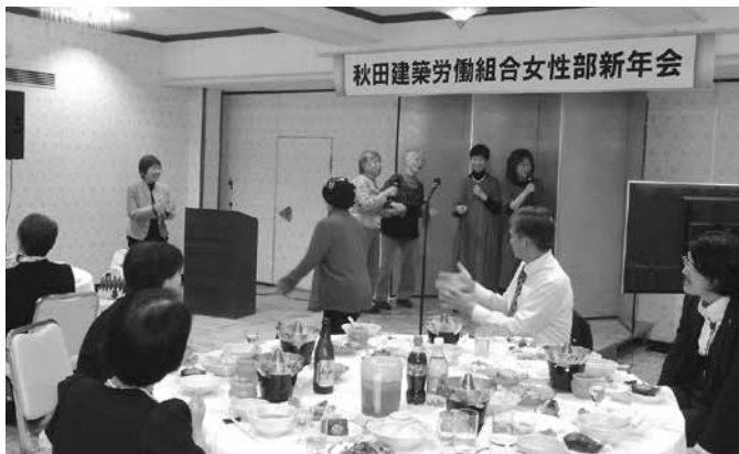
カラオケで大盛り上り

草薺会長の挨拶では「秋田市は雪が無いですね、角館は一日三回除雪をしました。今日はお天気も良く、きやどぼんぼんじいですね」と秋田弁もでした。