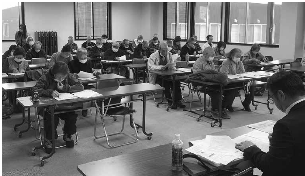
真剣な面持ちで講演を聞く参加者

最後に、意見交換でも青年部員の減少により活動行事の低下など、皆さんの課題があがりました。各支部の青年部や支部や本部、青年部長など仲間がいます。悩んだ時は「ホウレン、ソウ」です。今回参加してくれた皆様ありがとうございました。この記事を読んで頂ける青年部の皆さん一緒に活動して盛り上げていきましよう。待つてますよ。