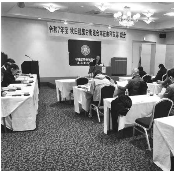
活発な意見交換がされました

迎え、祝辞の中では新年の挨拶とともに昨年7月の大雨被害についての話が多くの聞かれま