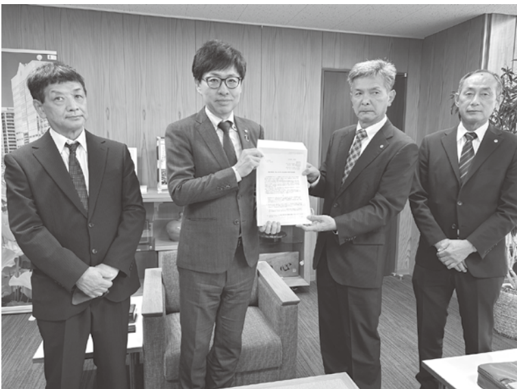
要請書を沼谷市長へ

①適正な賃金の支払いと法定福利費の確保 ②賃金・単価引き上げ ③処遇改善と賃金条項型の公契約条例 ④建設キャリアアップの対応と普及 ⑤リフォーム助成