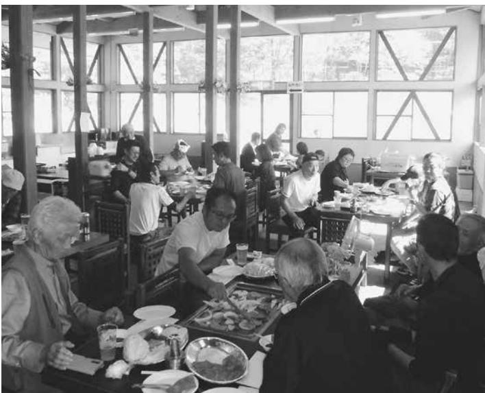
バーベキューを楽しむ参加者