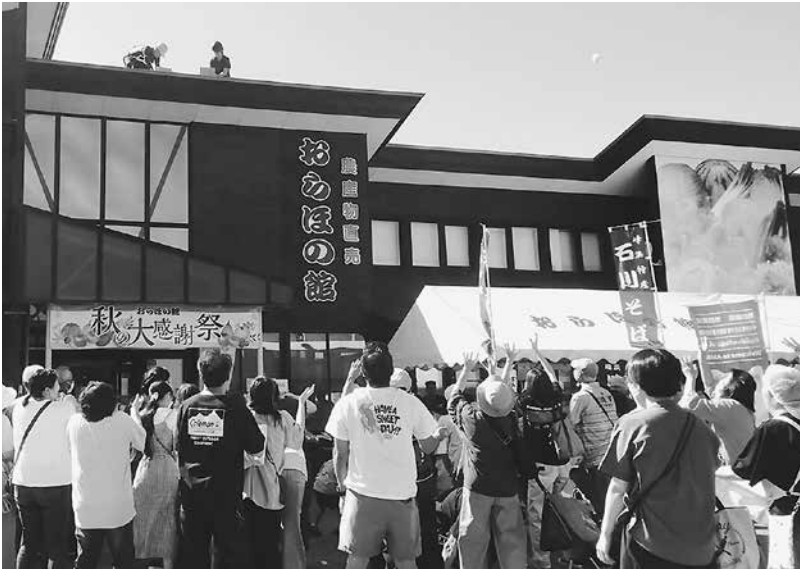
餅まきに大勢の来場者

住宅相談は少ないので周知方法が課題だと感じました。効果が期待できる内容を今後も模索していきたいと思っています。