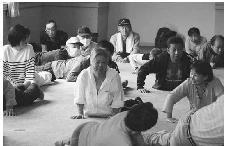
笑顔があふれる会場

また「太ももの筋肉は、歩行時に使われる場所、歳を取って弱ると歩けなくなるので、柔軟運動やもも上げをして鍛えておきましょう」とのことでした。たつぷりとしごかれましたが、終わればあつと言いつつ皆さんもやり切った笑顔がのぞかれました。終了後はお弁当と参加賞、入館券をもらって解散しました。