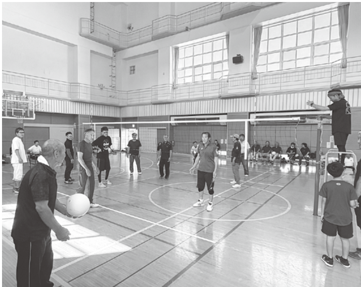
参加者でソフトバレーボール大会

知るとともに、生活習慣から見直し、多い人は塩分を控えるよう促す場面がありました。 美味しいお弁当で昼食を挟み、午後からはソフトバレーボール大会を行いました。 県南ブロック6出張所が優勝トロフィーを掛けて白球を追います。白熱する展開や、笑いが起こる場面もありました。